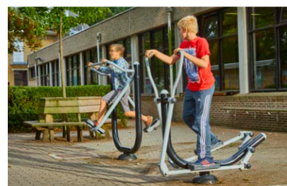
Moonwalker & Crosstrainer